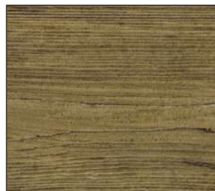
20 Sosnowa kora