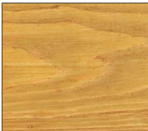
13 Sosna góraska