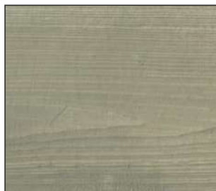
19 Oliwka bielona