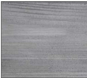
01 Klon srebrny