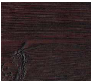
18 Ciemny machoń