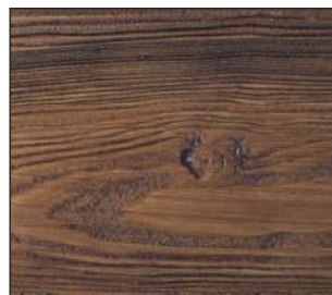
29 Ciemny orzech