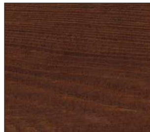
16 Cedr kanadyjski