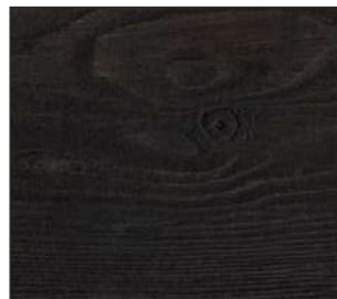
24 Wenge kongo