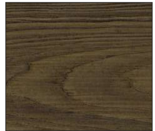
12 Śliwa łącka