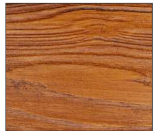
25 Dąb złoty