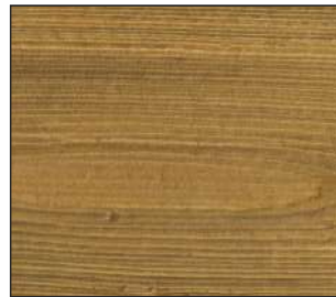
07 Dąb węgierski