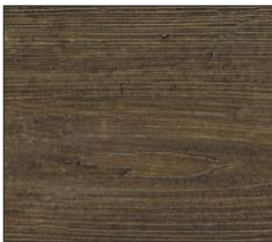
22 Drzewo bete