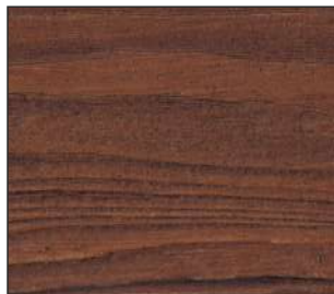
15 Dzika wiśnia