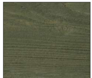
21 Hiszpańska oliwka