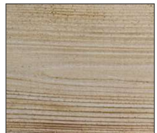
30 Sosna skandynawska