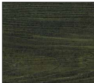
23 czarna olcha